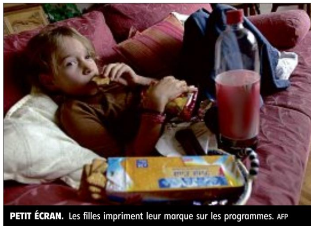
PETIT ÉCRAN. Les filles impriment leur marque sur les programmes.

Les studios Disney, souvent pointés du doigt pour leurs personnages de faibles princesses, ont initié une petite révolution en publiant récemment dix règles « pour être une princesse ». Si elles recommandent aux filles de « ne jamais abandonner » ou de « vivre sainement », ces nouvelles règles ne font jamais référence à leur style ou leur beauté. Depuis les années 1990, certaines héroïnes de Disney