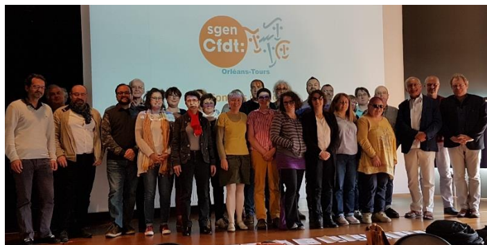
Clôture du Congrès 2019 au Lycée Camille Claudel

Sommaire : P. 1 : éditorial. PP. 2 & 3 : Retour de congrès académique. P. 3 : Elections Cneser : bons résultats à Tours et Orléans – Formation des élu·e·s CAPA. P. 4 : Sur notre site : Enfin des infos sur les PIAL – GRETA et GIP-FTLV-IP aux abonnés absents – Une Psychologue du Travail dans l'académie – Refus de stage syndical à des personnels de la MLDS.