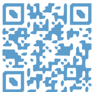
Comité Hygiène Santé et Sécurité au travail