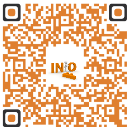
Retrouvez-nous lors de nos RIS...