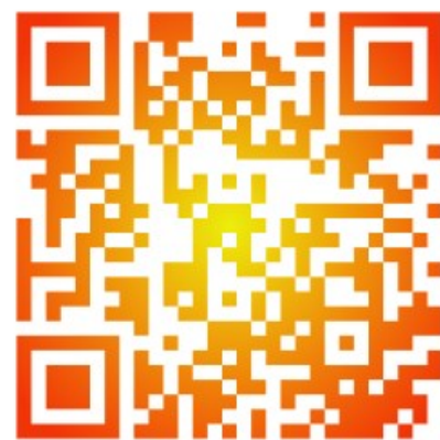
... et de nos formations !!