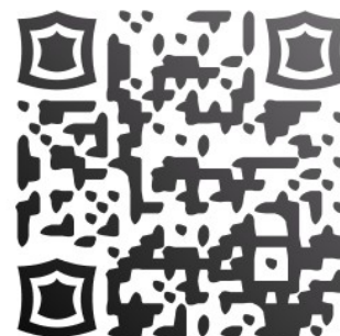
Congé maladie, enfant malade,...