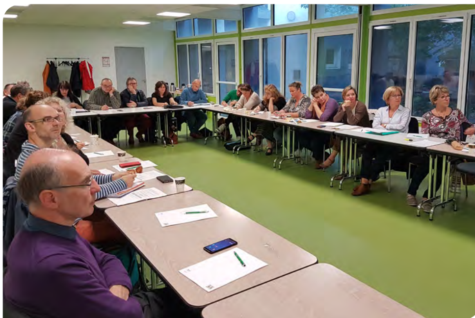
Les membres de la SRIAS en séminaire

A la suite des dernières élections professionnelles, la SRIAS a connu un profond renouvellement de ses membres. Elle a tenu sa première réunion le 14 mai 2019 au cours de laquelle les représentants syndicaux ont procédé à l'élection de son président. En tant que président de la SRIAS je remercie à nouveau les représentants du collège syndical de m'avoir renouvelé leur confiance pour ces quatre années à venir et de leur investissement dans le bon fonctionnement de cette instance. Les sept commissions de la SRIAS se sont en effet très vite mises au travail pour définir nos actions 2020 et lancer nos actions 2019. Ce travail a permis d'obtenir un budget supplémentaire qui a financé de nouvelles actions et de proposer un dispositif d'aide au logement temporaire, comme des places supplémentaires dans les crèches ayant répondu au marché qui a été lancé. Je ne peux que regretter qu'une nouvelle fois le budget de la SRIAS ne soit pas augmenté en restant à 159 406 € pour environ 97 000 agents actifs de l'Etat sur la région, (soit environ 1,64 €/agent). Dans un contexte de transformation de l'action publique, de réorganisations de services, de contraintes budgétaires fortes, les actions des SRIAS ont toute leur importance. Toutefois, nous espérons bien obtenir comme en 2019 une enveloppe supplémentaire pour continuer à répondre à vos attentes. Alors, par anticipation, je vous souhaite de bonnes fêtes de fin d'année et une heureuse année 2020 au nom de tous les membres de la SRIAS.